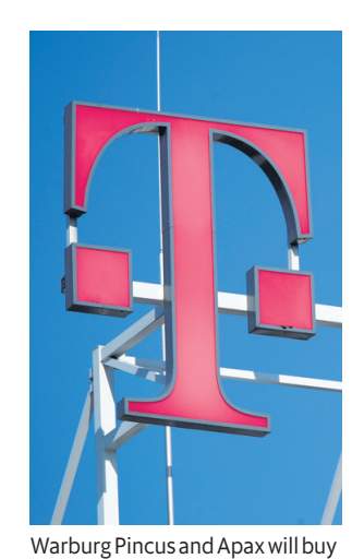
T-Mobile Netherlands for $6.1 bn from Deutsche Telekom and venture partner Tele2, which owns a 25% stake.

T-Mobile US accounts for nearly two-thirds of Bonnbased Deutsche Telekom's sales. The unit raised its forecast for user growth in July and plans to build out capacity, targeting new businesses. Deut sche\,Telekom\,shares\,rose\,0.5\% to €17.98 at 10.32am in Frankfurt trading. The stock has gained 20% this year. SoftBank shares closed 9.9% higher.