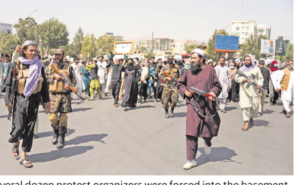
Several dozen protest organizers were forced into the basement of a nearby bank, and many others were detained.

"We must continue our protest against dirty Pakistan, which is interfering in Afghanistan. Why is Pakistan not being sanctioned? We will never recognize this government,