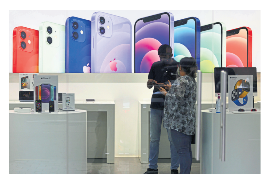
Apple's walled garden and payment limitations are key issues in the case brought by

Apple's walled garden and payment limitations are key issues in the case brought by Epic Games. The federal judge who presided over the trial earlier this summer is expected to issue a ruling soon. A loss would be another serious dent in Apple's armour, but even a victory for the iPhone maker seems unlikely to settle the